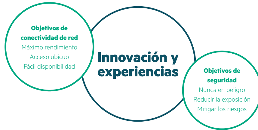
Figura 1. Objetivos de red y seguridad

Es necesario adoptar un nuevo enfoque para organizar los datos de una forma segura, sencilla y automatizada, uno que facilite al departamento informático colaborar de una manera más productiva en lo referente a funciones de conectividad de red y seguridad y que permita actuar y reaccionar allí donde sea necesario, a la vez que se instaura una seguridad máxima y se contribuye a cumplir con los requisitos normativos.